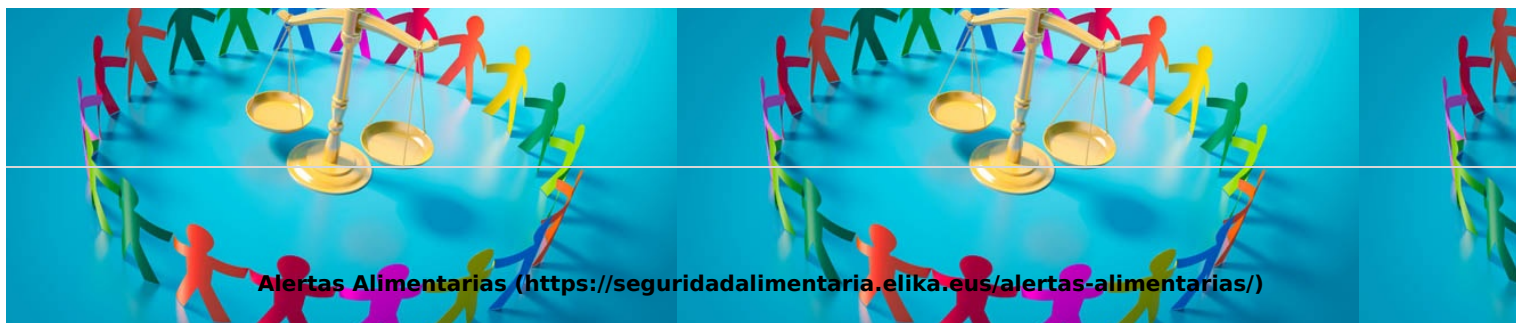
Alertas Alimentarias ( https://seguridadalimentaria.elika.eus/alertas-alimentarias/ )

( http://www.aecosan.msssi.gob.es/AECOSAN/web/seguridad_alimentaria/subseccion/legislacion_seguridad_alimentaria.htm )