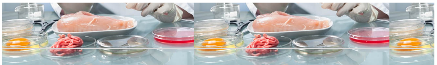
Normativa de Seguridad Alimentaria

Las decisiones tomadas para la gestión de riesgos en aras a proteger a la ciudadanía de los riesgos alimentarios contemplan la puesta en marcha de actuaciones normativas (establecimiento de la legislación alimentaria) y actuaciones instrumentales y ejecutivas, estas últimas dirigidas a aumentar el conocimiento (acciones de investigación), a vigilar y controlar los riesgos (planes y programas de vigilancia y control), a establecer de protocolos de gestión de alertas alimentarias para actuar de manera rápida, a informar y comunicación a la ciudadanía y a todas las partes interesadas en caso de riesgo, etc.